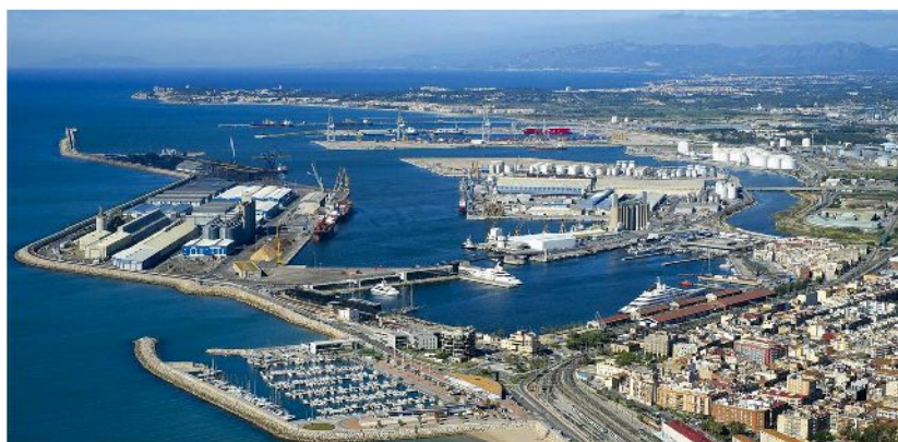
Puerto de Tarragona